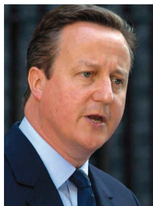
El primer ministro de Gran Bretaña David Cameron.

Para los británicos lo importante era el imperio de "Su Majestad", tan vasto que se decía que el sol jamás entraba en el ocaso, y para ello crearon, hace casi un siglo, el llamado Comonwealth, una forma de dominar muy