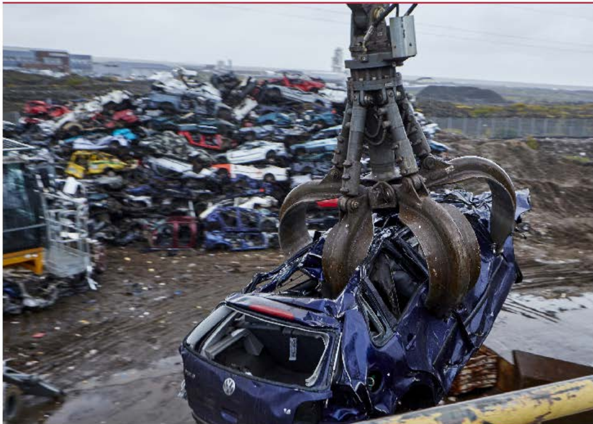
Bílekirkjugarður Ríflega fjögur þúsund bílum hefur verið fargað það sem efer ári. Það er fjölgun frá hruni. Sjá síðu 4 fréttablaðið. Ritstjórn