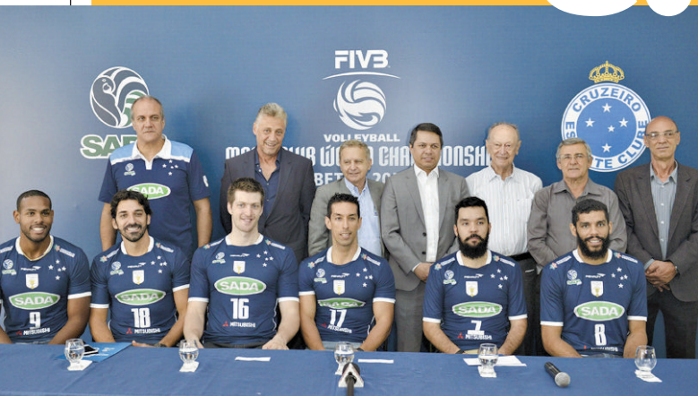
Jogadores e dirigentes apresentaram ontem o Mundial de Vôlei 2015