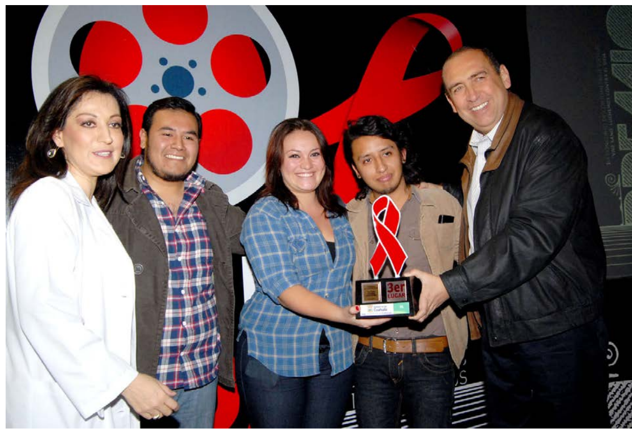
EL GOBERNADOR Rubén Moreira, y la Secretaria de Salud Bertha Castellanos, entregaron los premios a los ganadores del concurso de cortometraje virtual

Se encuentra ubicado a 72 km al noroeste de la ciudad de Hartford, capital del estado de Connecticut y a 96 km de distancia de la ciudad de Nueva York, aproximadamente, al noreste de Estados Unidos de América.