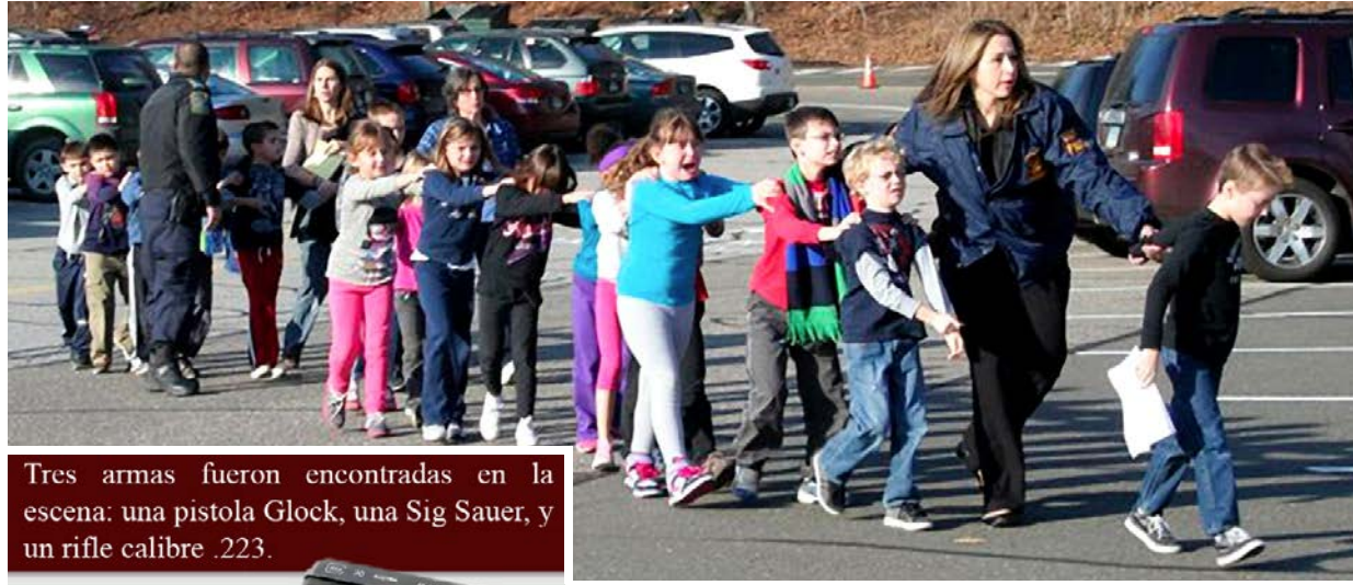
Tres armas fueron encontradas en la escena: una pistola Glock, una Sig Sauer, y un rifle calibre .223.

Los menores y sus padres dijeron que los profesores se encerraron en las aulas con los alumnos y les ordenaron que se fueran todos a las esquinas o que se ocultaran en los armarios cuando los disparos retumbaban en el edificio. Las autoridades no precisaron la mane-