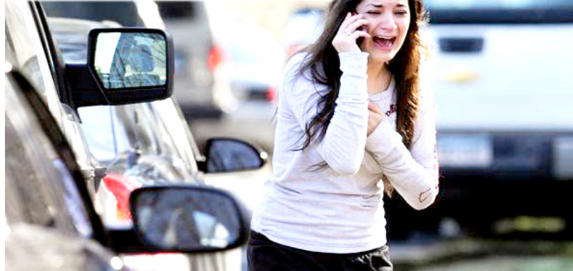
ESCENAS TRÁGICAS Se vivieron ayer en una de las peores matanzas en la historia de Estados Unidos

LOS SOBREVIVIENTES Fueron evacuados por sus maestros, una vez que pasó el peligro