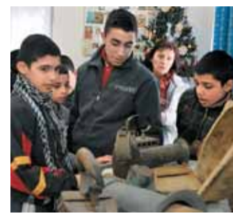
A kiállításon

váth Jenő elárulta azt is, hogy a település bátran használja fogja marketing eszközeiben a nekik ítélt címet. - Jövő tavasszal kezdődik a Füzéri Vár teljes rekonstrukciója, azonban hangsúlyoznám, hogy a vár látogatható lesz! Sőt, terveink szerint látogatóink betekinhetnek az építkezés folyamatába is. - tette hozzá a zempléni község polgármestere. Mint ismeretes korábban több mint 1,3 milliárd forintot nyert pályázati úton a Füzéri Városgondnokság a Füzéri vár rekonstrukciójára, amely két évig tart majd. ÉM-JLI