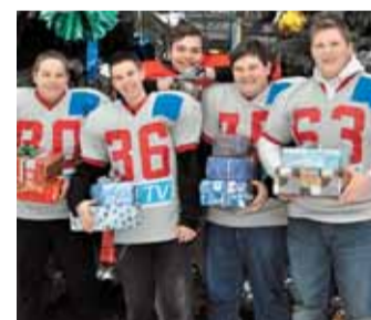
Steelers fiúk

BUDAPEST, BELGRÁD. A magyar női kézilabda-válogatott szombaton 14.30-tól Norvégia ellen vív elődöntőt a Szerbiában zajló Európa-bajnokságon. A szervezők külön szektort biztosítanak a magyar szurkolóknak, a honi szövetség tájékoztatása szerint szombatra és vasárnapra összesen 2000 belépőt tartanak fenn a drukerek számára. /9. ÉM