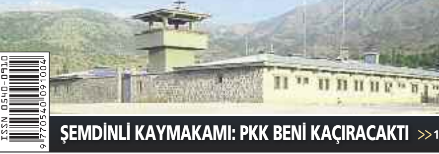
ŞEMDİNLİ KAYMAKAMI: PKK BENİ KAÇIRACAKTI >>16'da

PKK, Şemdinli'deki Omurlu Sınır Jandarma Tabur Komutanlığı'na dün bir kez daha ateş açtı. Bu hafta üç kez tekrarlanan saldırılara Tabur'daki askerler anında karşılık verdi ve terörist grup bölgeden uzaklaştı. Irak sınırına yakın noktada, sarp tepeler arasında kurulu taburdaki binalar 2010'da güçlendirilmişti. >>16'da