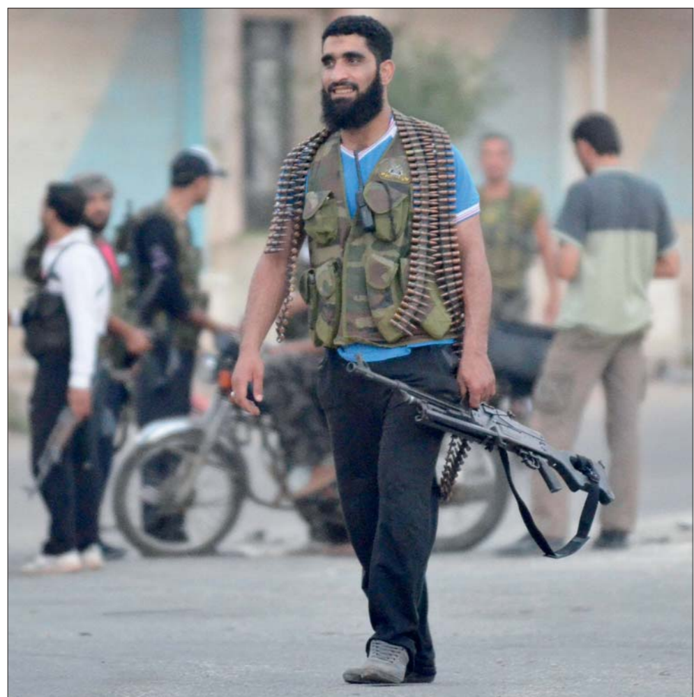
عصر من «الجيش الحر» في سرمد قرب إدلب أمس

سوريا وبرهنت عن التزامها التام والكمال بتنفيذ خطة أنان ذات المراقبين في تحقيق المهمة المرجوة لكن على الدوام كانت الدول التي تستهدف زعزعة استقرار سوريا، والتي وافقت وصوتت لإسحلة الخطة المذكورة في مجلس الأمن الدولي، هي ذاتها الدول التي عرقلت وما زالت تحاول أفشال هذه المهمة لأن النيات لم تكن صادقة أبداً في مساعدة سوريا على تخطي أزمستها بما يتوافق مع إرادة وتطلعات الشعب السوري، وقد تمثلت العرقلة في دعم وتسليح وإسواء الجموعات الإرهابية المسلحة، ما أدى لاستمرار العنف الدائر في سوريا.