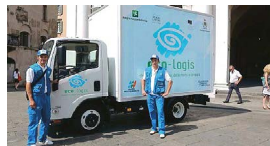
Uno dei nuovi mezzi presentati ieri a Brescia