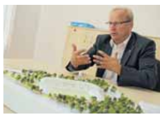
Lenyűgözte a környezetet