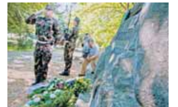
A debreceni csata évfordulóján

célra fel lehet használni, mert munka lenne bőven. Azt is többen megjegyezték: jó, hogy nem a 22 800 forintos segélyt kapják, de akadnak olyan állástalanok, akiket a jelenlegi 47 ezer forintos bér sem motivál. Nyolcórás munkát illene nagyobb fizetéssel elismerni, mert így többek előtt nincs becsülete. /3. HBN-ÉP