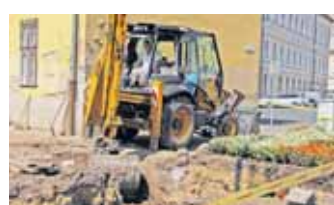
A régi városháza mögött

Június végén közöltük a hőszolgáltató karbantartási és felújítási munkáinak ütemezését a belvárosban. Az augusztus második hetéig tartó folyamat a Petőfi téren kezdődött, és a Plazáig 6 ütemben végzik az elhasználódott alkatrészek, csövezetékek cseréjét, illetve a hálózat felújítását. Az ütemezés szerint a Dósa nádor tér környékén július 26-ára már a helyreállítási munkákat is el kellett volna végezni, ehhez képest még csak ezen a héten bontották fel a régi városháza mögötti területet. /3. HBN-ÉP