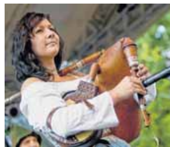
Bordó Sárkányék