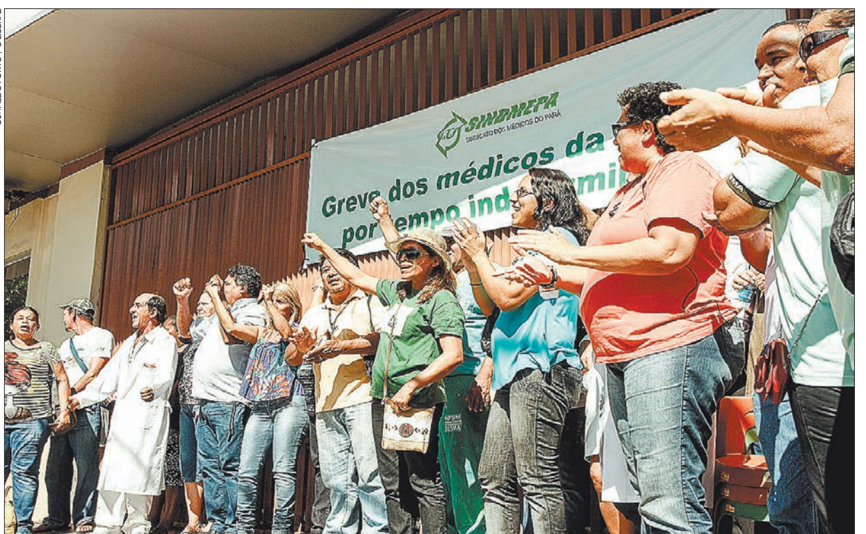
Mobilização - No primeiro dia da greve na saúde, os servidores fizeram vários protestos

tos suspendam a greve, sob pena de terem de pagar multa diária de R$ 10 mil. O primeiro dia de paralisação foi marcado por protestos em frente a unidades de saúde e prontos-socorros. Página 9.