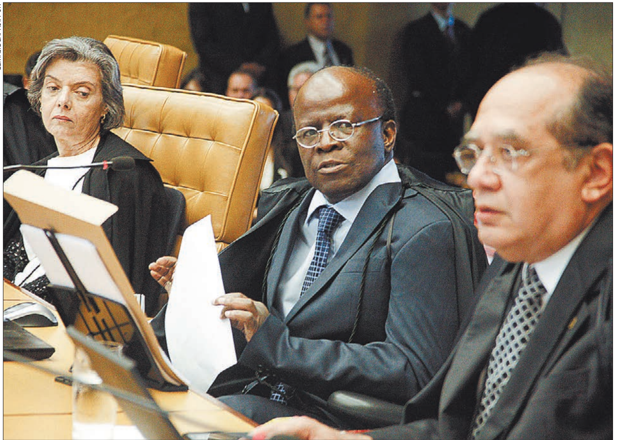
No plenário - Joaquim Barbosa (ao centro) irritou-se com tentativa de desmembrar processo

Por 9 a 2, o plenário rejeitou pedido da defesa de um dos réus, para que 35 denunciados fossem julgados por instâncias inferiores do Poder Judiciário. Durante os debates, Joaquim Barbosa e Ricardo Lewandowski, relator e revisor, discutiram asperamente. Poder, 1 a 4.