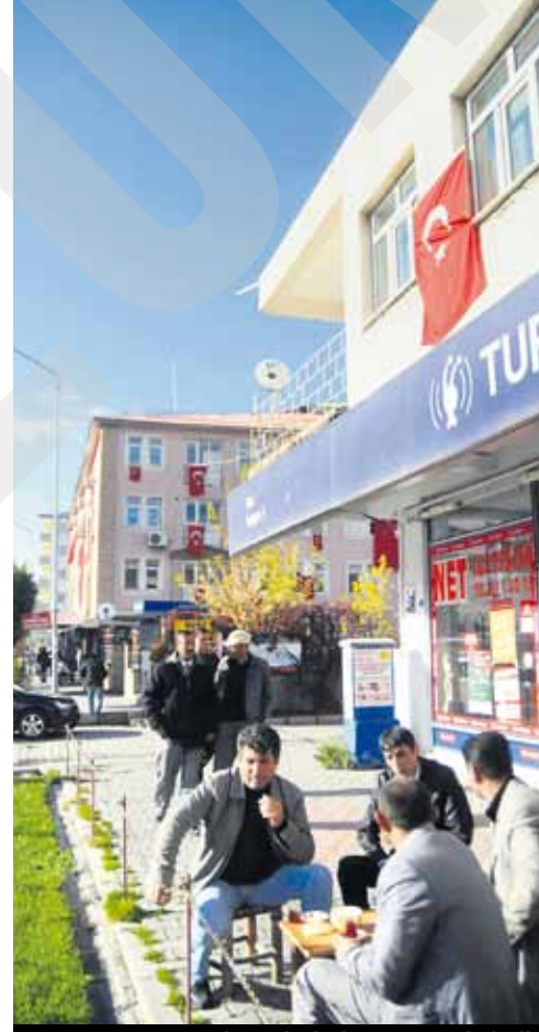
Terör örgütünün kana buladığı Norşin'de halk, katledilen vatandaşların yasını tutuyor. Bütün ev ve işyerlerine Türk bayrakları asıldı.