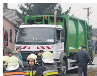
Az autó alá esett a néni