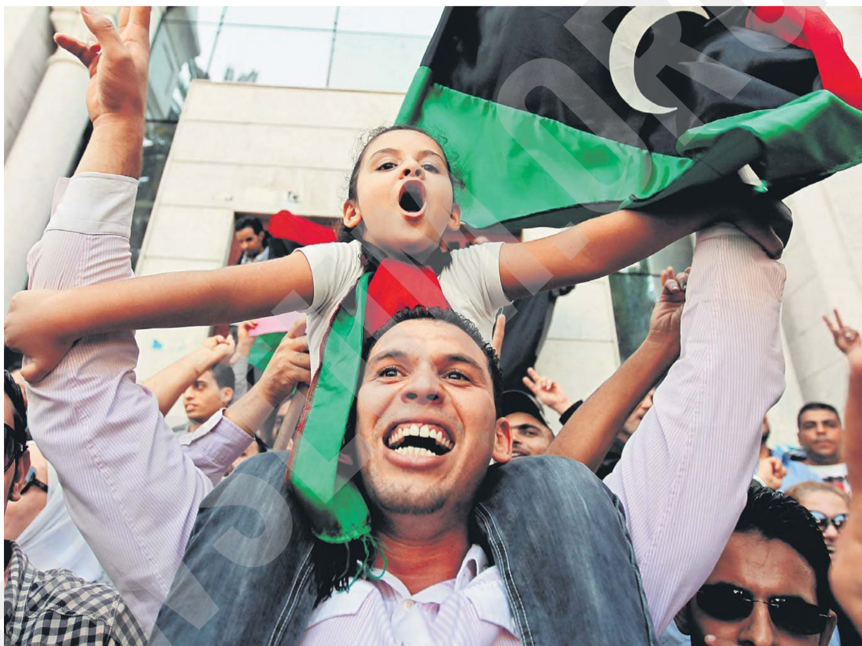
Líbia népe örömjongásban tört ki, miután az Átmeneti Nemzeti Tanács végül tegnap délután hivatalosan is bejelentette Moammer Kadhafit halálhírét

Szülővárosában fogták el a diktátort, aki belehalt az akcióban szerzett sérüléseibe