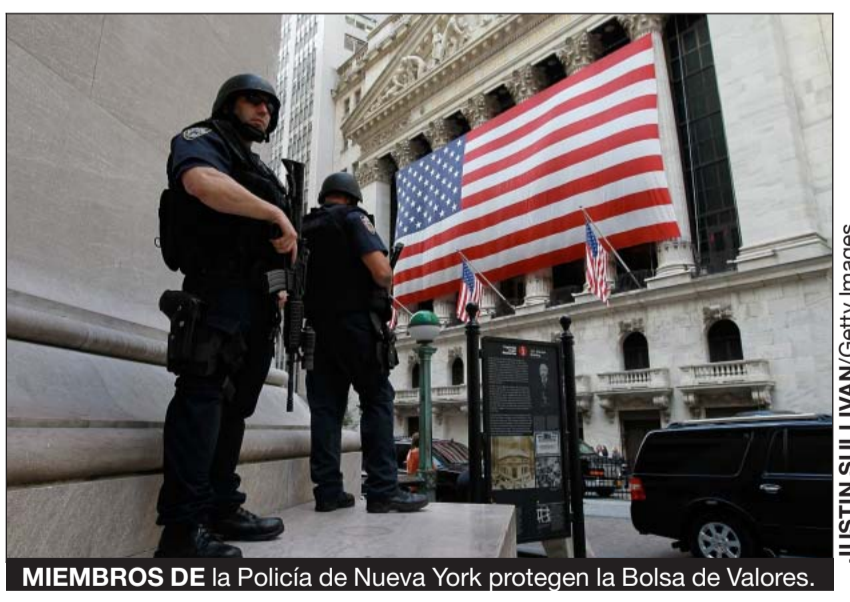
MIEMBROS DE la Policía de Nueva York protegen la Bolsa de Valores.

Las autoridades se movilizaron el viernes en Estados Unidos ante “una amenaza creíble” pero “no confirmada” de atentado, dos días antes del décimo aniversario del 11 de setiembre, después del cual algunos esperaban dar final-