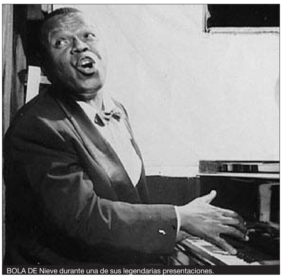
BOLA DE Nieve durante una de sus legendarias presentaciones.