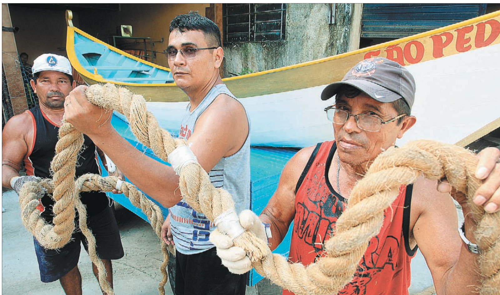
Vigia de Nazaré - Devotos de Nossa Senhora preparam a corda para a Trasladação de hoje à noite e para o Círio de amanhã