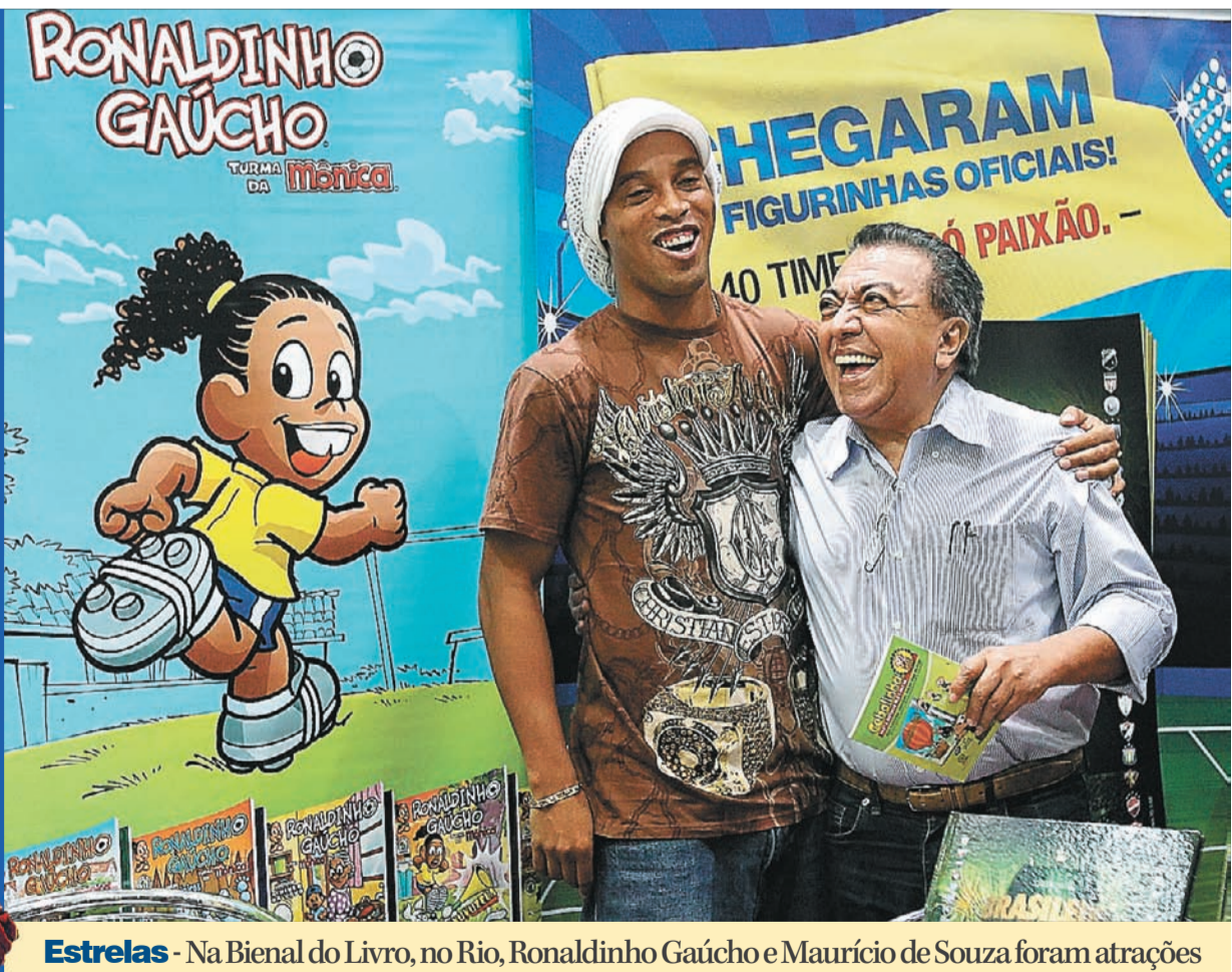
Estrelas - Na Bienal do Livro, no Rio, Ronaldinho Gaúcho e Maurício de Souza foram atrações