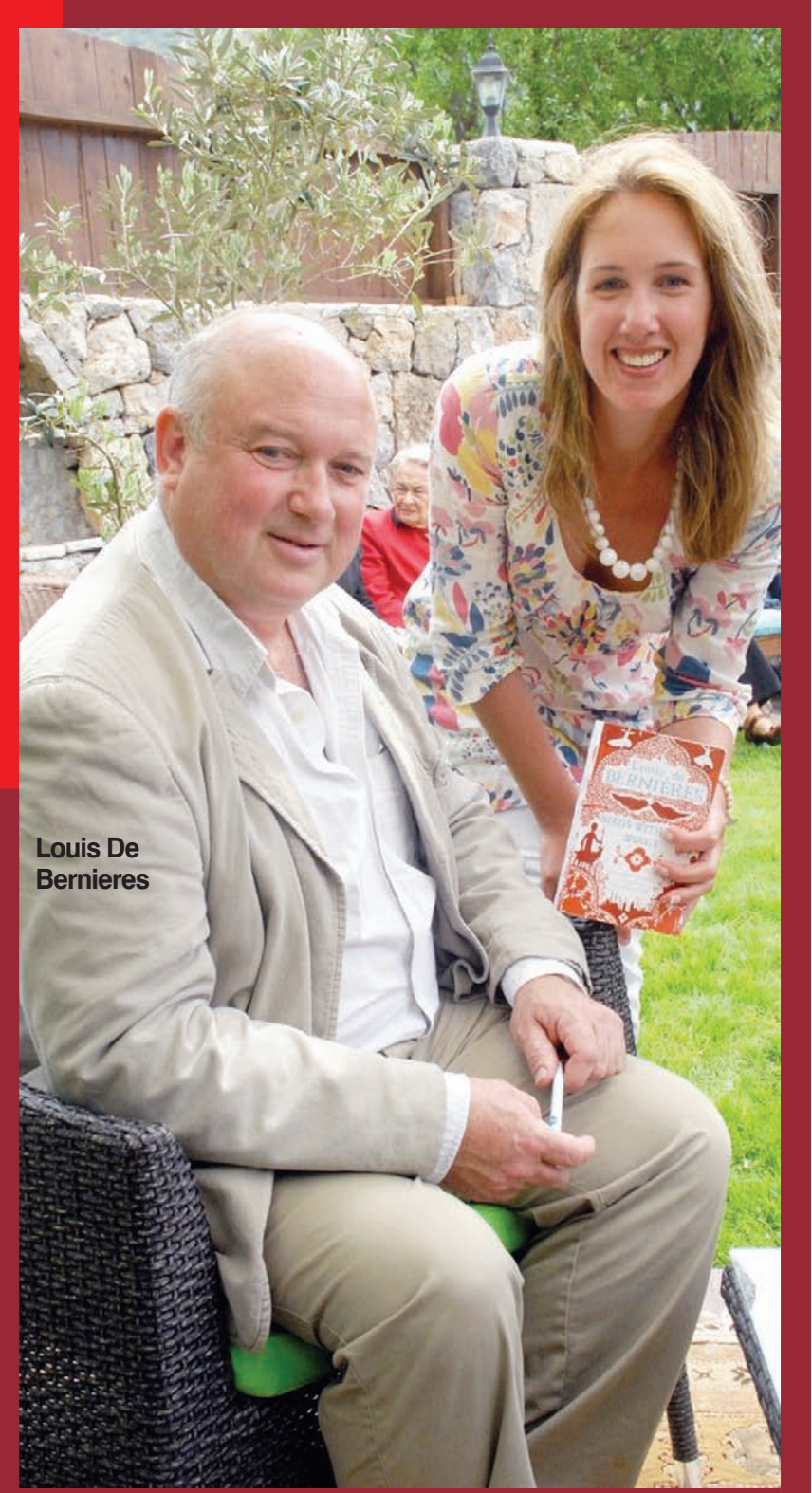
Louis De Bernieres

BİR skandal da baspolis sınavında yaşandı. '40 net' yapan sınavı kazananın, 60 net yapan başansız oldu. ■ 3'te