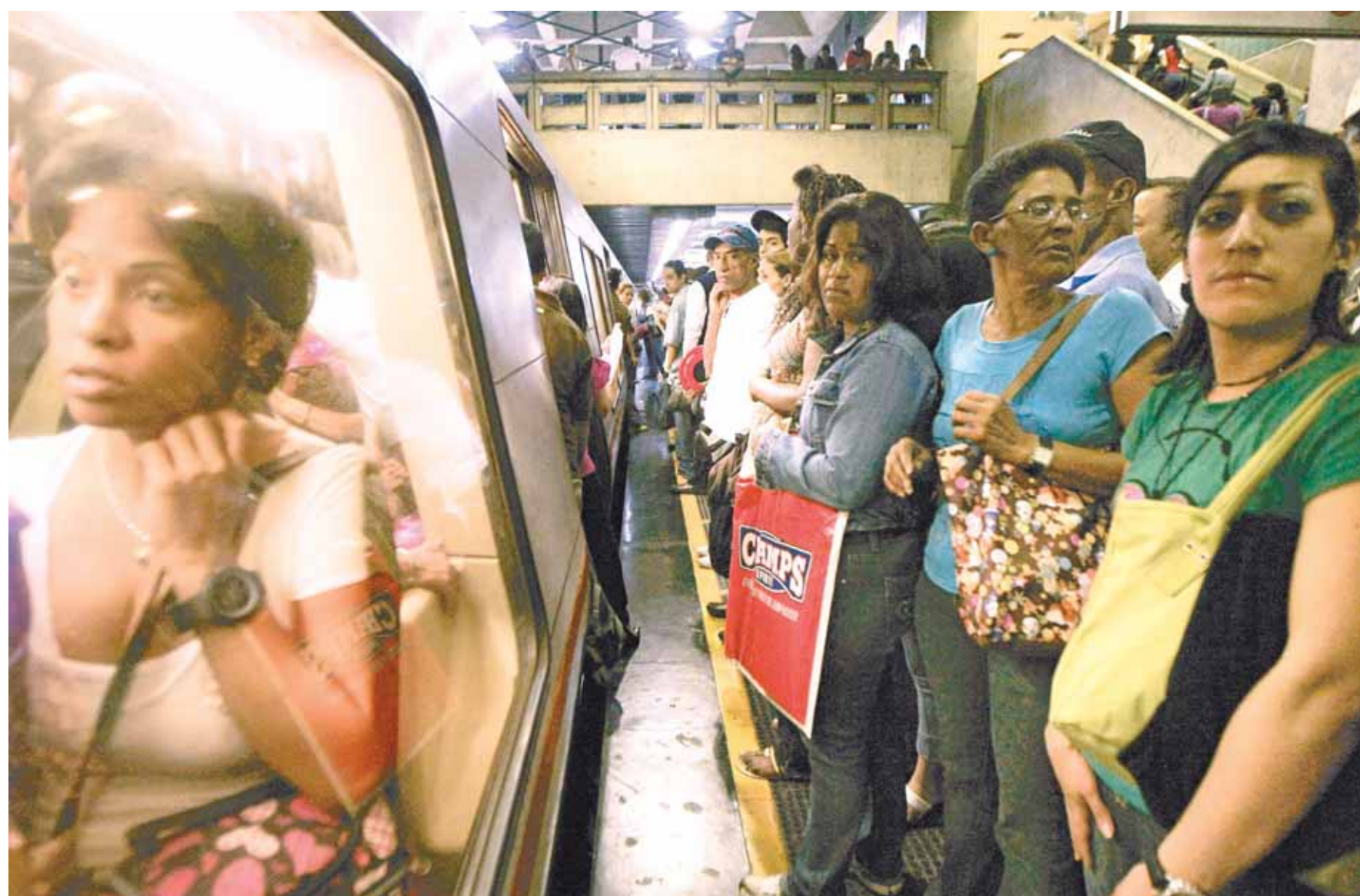
El subterráneo caraqueño ya no tiene hora pico, siempre está colapsado, pues a medida que pasa el día los trenes fallan y tienen que reducir unidades en circulación

La crisis ha llegado a niveles tales que hace un mes los operadores firmaron un documento donde no se responsabilizan por manejar con dos vagones aislados, ya que según el Manual de Procedimiento conducir un equipo rodante en esas condiciones es un riesgo para la prestación del servicio. • En cada tren, dos de sus siete vagones están inservibles porque sus motores de tracción y los frenos no funcionan, por lo que técnicamente quedan "aislados". • De los 40 trenes que parten cada madrugada, a medida que pasan las horas van fallando: en promedio, el número de unidades se reduce a diario entre 10 y 50%. • Como la cifra de trenes disminuye, los pasajeros sienten que ya no hay horas pico. • Al dejar de circular un tren, se deja de movilizar a 2 mil personas. 3-2