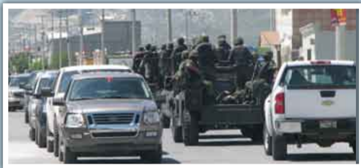
Al acecho. Comandos terrestres a bordo de camionetas militares y civiles inspeccionaron las colonias del nororiente, ante la sorpresa de los saltillenses.

A partir de entonces y hasta después de las 17:00 horas, las naves de asalto sobrevolaron