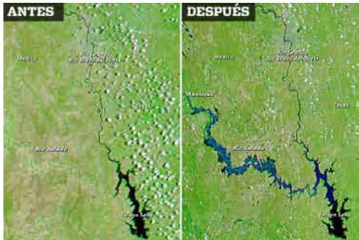
Evidencia. Una imagen satelital muestra la inundación que llevó el río Salado, tras abrirse las compuertas de la presa Venustiano Carranza, en Coahuila.

Hizo un llamado para que se coordinen diversas acciones de apoyo y se agilice la liberación de los recursos del Fondo de Desastres Naturales (Fonden), para la reconstrucción de los municipios afectados por el