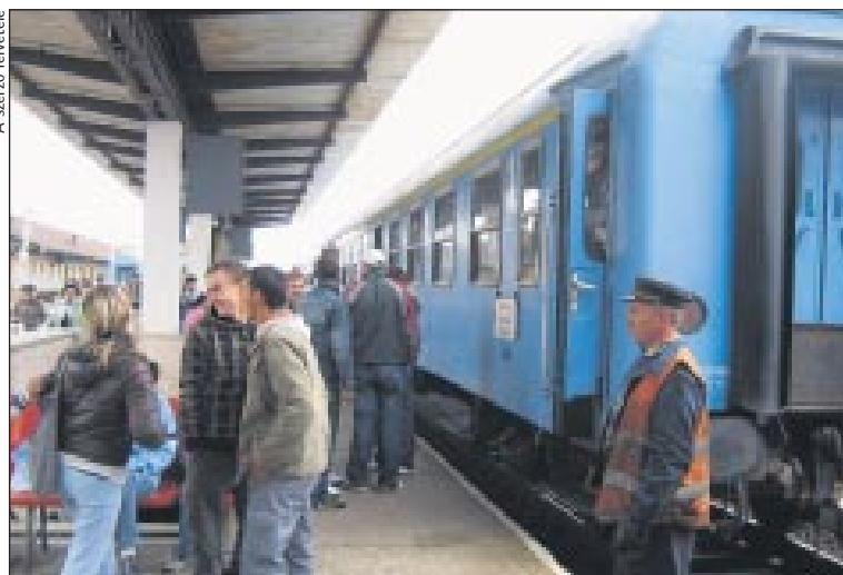
Poggyászállító vagonokat csatolnak a gyorsvonatokhoz

san. Tegnap 16 óráig 31 505-en szavaztak, akiknek a túlnyomó többsége, pontosan 93,70%-a szerint nagyon jó, 1,79%-a szerint pedig jó ötlet ez a kezdeményezés. A szavazók 0,68%-a elfogadhatónak tartja, míg 1,27%-a ellenzi az elképzelést.