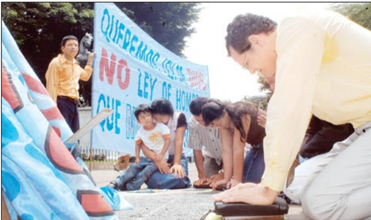
Un grupo minoritario de pastores evangélicos se apostaron en las afueras del Parque Centenario, en Guayaquil, para orar por el voto NO al proyecto de Constitución.

Gastos. Gobierno es el que más invierte en promoción