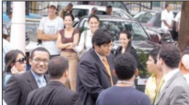
Estudiantes presentaron un video de los hechos.