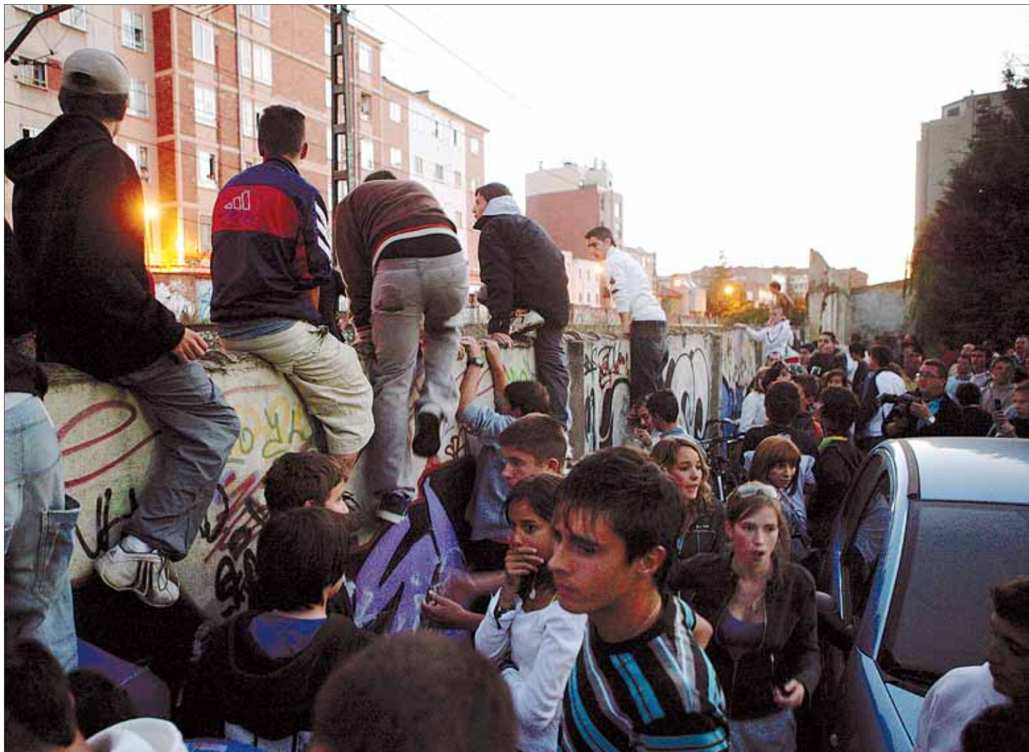
Numerosos jóvenes accedieron a las vías saltando la valla situada junto al lugar en el que ocurrieron los atropellos hace una semana.

► Parte de los concentrados se manifestaron por las vías del tren, entre el paso a nivel de Las Casillas y la calle Madrid ► Durante la marcha se cortaron además varias calles BURGOS67