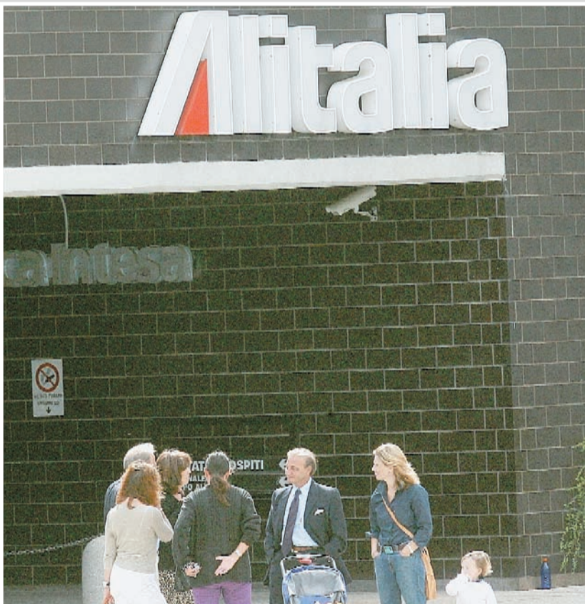
Salvataggio. AirOne pronta a salvare Alitalia e Malpensa

Toto: pronti a una fusione e a salvare le rotte di Malpensa