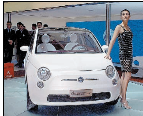
Nuova 500, è veloce per i giovani (A pagina 6)

E' veloce, la nuova 500 vietata ai neopatentati