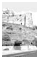
Scippo a Torrione