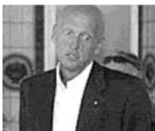
Pierluigi Collina si dimette e sbatte la porta

Il numero uno dei fischiati italiani scatena l'ennesima bufera Carraro: «Non si cambia in corsa»