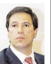
FERNANDO SANCLEMENTE director de la Aerocivil

Luego de meses de negociación, el concesionario Opain y la Aerocivil lograron "aterrizar" en un documento las características del proceso de ampliación del aeropuerto Eldorado. Según el acuerdo, demolerán el edificio existente y hasta la torre de control será cambiada por una construcción 30 metros más alta.